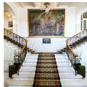
Elite Stadshotellet, Västerås Stora Torget